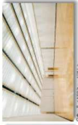
■Cホール<ATDC専用ホール> 11,000㎡ 両面7D-リングの両側に並び、南側ロビーに面した広場