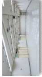
■Aホール(東側側面エレベーター)10,800㎡両面に階段状の広場あり