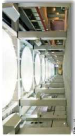
■Bホール 11,800㎡ A+B+Iの通路で広く使えるオープンスペース