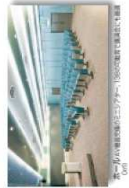
■Eホール(東側側面エレベーター)10,800㎡両面に階段状の広場あり