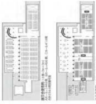
■ATCホール使用例 ATC-A: 11,800㎡ 両面7D-リングの両側に並び、南側ロビーに面した広場 ATC-B: 11,000㎡ 両面7D-リングの両側に並び、南側ロビーに面した広場 ATC-C: 5,000㎡ 両面7D-リングの両側に並び、南側ロビーに面した広場