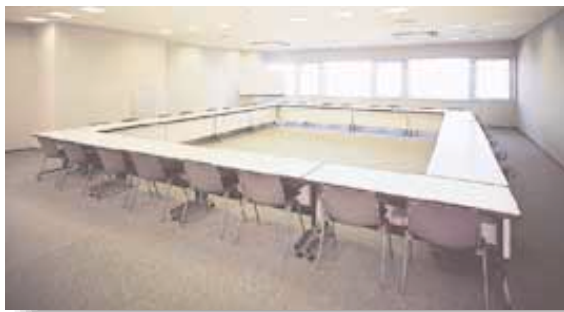
会議室 30～80名対応の研修会等に最適