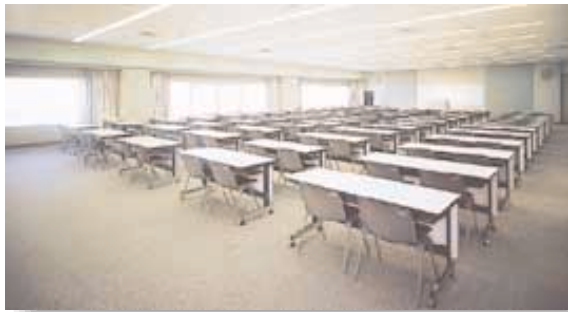
コンベンションルーム 100名以上の講演会、 セミナーなどあらゆる催しに対応