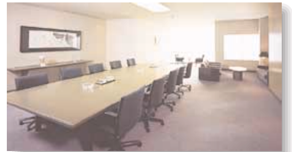
B6会議室 (スイート) 室内に应酬セットのある VIP対応貴賓室

このページはPDF形式で ダウンロードできます。 PDFはフォントを埋め込んだ ver.4.0形式です。 ver.3.0で開いた場合 文字化けをおこしますので ご注意ください。