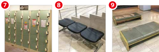
荷物ロッカー ソファベンチ小 (46台) ソファベンチ大 (4台)