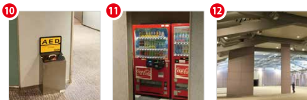
AED 自動販売機 スライディングウォール パントリー(3ヶ所)