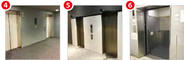
北側エレベーター (2基) 南側エレベーター (1基) 業務用エレベーター (1基)